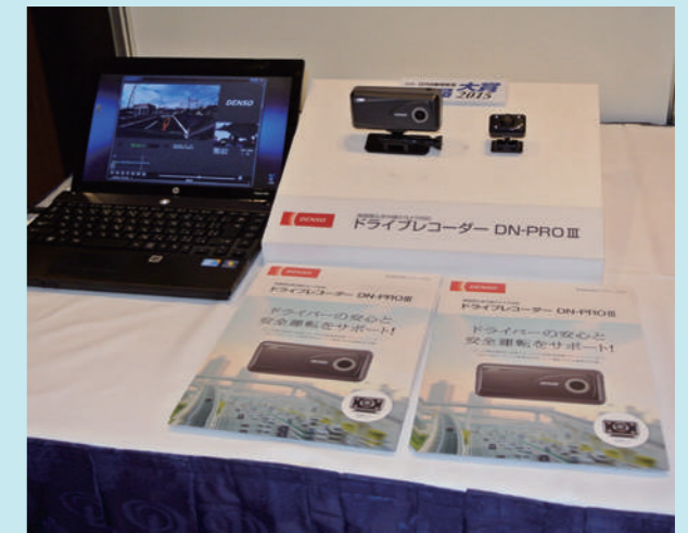
ドライブレコーダー DN-PRO III

を中心にデンソーセールスが取扱う幅広い製品ラインナップの中から注目商品を展示した。